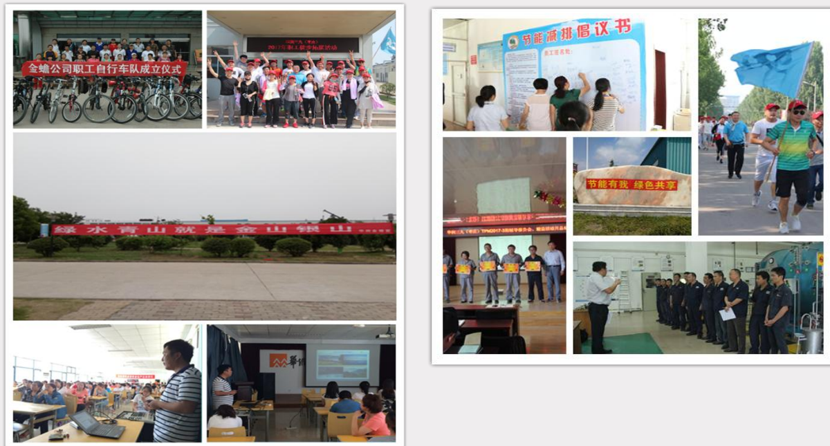
节能宣传周及全国低碳日活动

工理解环保的重要性并掌握日常生活中节能常识。通过以上活动的实施，呼吁大家在“节能、减排、低碳、环保”方面从我做起，从点滴做起，强化了华润三九员工的节能减排意识，营造了良好的节能减排氛围。