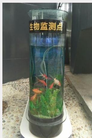
郴州三九污水经处理后养鱼用于水质监测