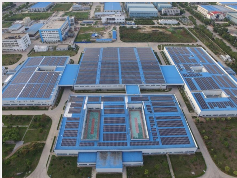
华润金蟾屋顶光伏发电全景

1、华润金蟾药业股份有限公司（以下简称“华润金蟾”）联合华润电力，由合作方出资3569.33万元，建设屋顶光伏发电项目。项目建成实际总装机容量为5.89MW，整个光伏系统全年可利用小时数为1026h，全厂发电效率81%，首年发电量约为674万kWh，在25年运营周期中可实现总发电量约为15038万kWh，年平均发电量约为602万kWh。与同容量燃煤发电厂相比，每年可节约标煤约1815.7吨，相应可减排燃煤所产生的SO 2 约145.3吨，减排温室气体CO 2 约4720.8吨，相当于每年为城市增加了12.7公顷的森林面积。